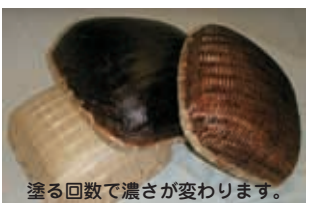
塗る回数で濃さが変わります。

●木材に塗装すると、木材の表面に強固な塗膜を作らず、木材に浸透することで木材の通気性が保たれ、木目の美しさが引き立ち、自然なツヤと風合いがつけられます。